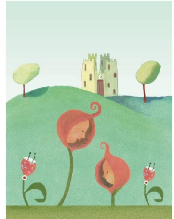
Illustration: Marianna Mengarelli

Les enfants, adolescents et leur famille doivent être adressés avec un courrier par le pédiatre ( pour les enfants âgés de 0 à 3 ans uniquement), le pédopsychiatre ou le neuropédiatre référent.