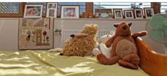
Personnaliser sa chambre