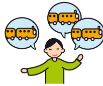
Parle de façon incessante sur un sujet particulier