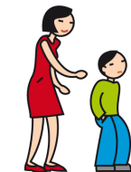
Manifeste de l'indifférence