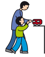
Indique ses besoins en utilisant la main d'un adulte