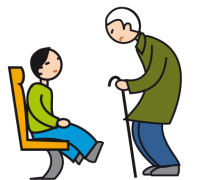
Comprend mal les conventions et les règles sociales