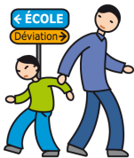
N'apprécie pas les changements