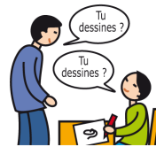
Utilise le langage de façon écholalique