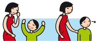
Rit de façon inappropriée