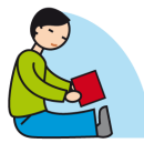
Manque de jeux imaginatifs