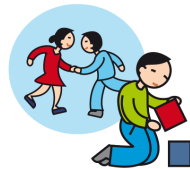
Ne joue pas avec les autres enfants