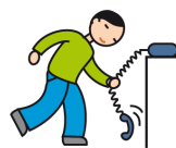
Utilise les objets de façon atypique