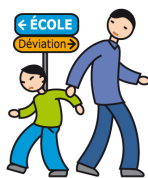
N'apprécie pas les changements