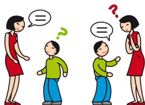
A du mal à comprendre et à se faire comprendre