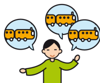
Parle de façon incessante sur un sujet particulier