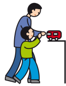
Indique ses besoins en utilisant la main d'un adulte