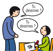
Utilise le langage de façon écholalique