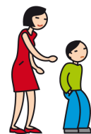
Manifeste de l'indifférence