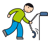
Utilise les objets de façon atypique