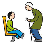
Comprend mal les conventions et les règles sociales