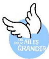
Illustration : Marianna Mengarelli